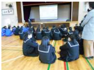
タブレットでグループの意見を集約

「文部科学省 地域との協働による高等学校教育改革推進事業」の一環として、今年から開設された授業です。地域との協働を進めながら学んでいきます。当日は、ガイダンスということで2クラス合同でしたが、密を避けて体育館で実施しました。タブレットも活用して、地域の特徴についてグループで話し合いながら、今年の学習の計画についてレクチャー受けました。