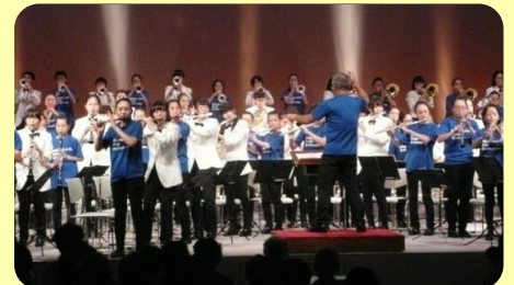
三国中吹奏楽部と合同演奏

みくに文化未来館の現在のホールでの最後のコンサートが行われ、吹奏楽部が感謝の気持ちを込め熱のこもったステージを披露。フィナーレは坂井市の歌「しあわせの花」を総勢250人と共に演奏し、観衆と一緒に歌い上げ有終の美を飾りました。