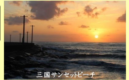
三国サンセットビーチ